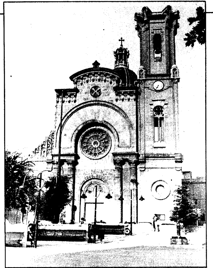
Dentro del distrito, pero poco